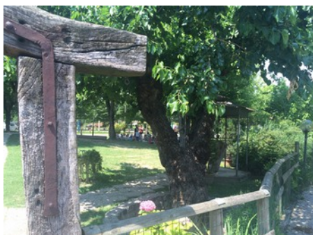
Il meraviglioso giardino del Vecio Moraro